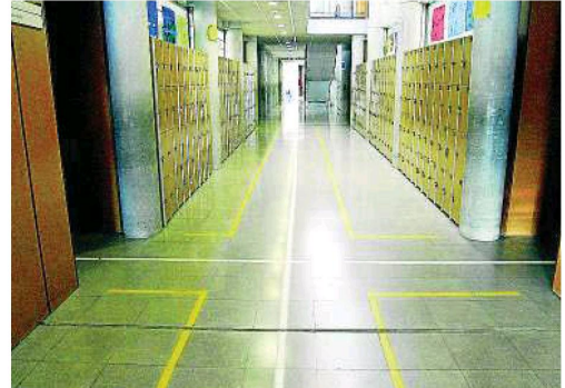
Les línies s'han traçat amb l'ajuda d'una màquina que hi ha al centre.