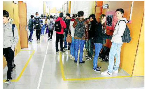
Els joves esperen entrar a classe a la zona delimitada en groc.

vegades et trobes que alguns van en contradi direcció". L'equip directiu es mostra obert a noves propostes per tal d'aconseguir que els intercanvis de classe siguin encara més ràpids i menys conflictius.